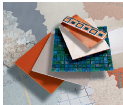
Variables Leistungsspektrum – für alle Untergründe und alle keramischen Beläge.