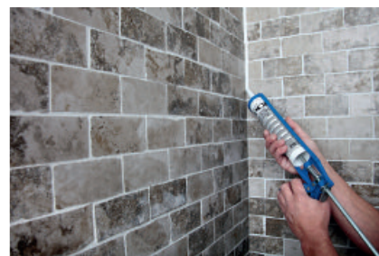
Durch den Einsatz von PCI Carraferm entstehen keine Randzonenverfärbungen bei Naturwerksteinen.