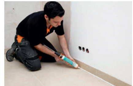
Elastisches Schließen von Boden-Wand-Fugen mit PCI Silcoferm S ohne störende Geruchsbelastigungen während und nach der Verarbeitung.