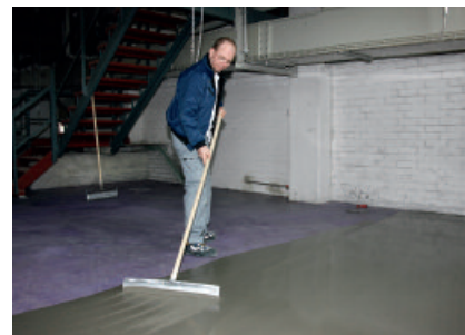
Mit PCI Periplan® Multi läßt sich ein schnell belastbarer Bodenausgleich einfach herstellen.