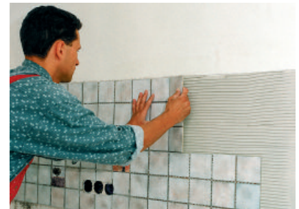
Die Fliesen rutschen nicht ab und können noch einige Zeit ausgerichtet werden.