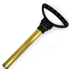
Profi Messingpumpe mit Stahlkolbenstange