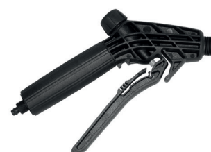
ergonomisches Abstellventil mit Filter