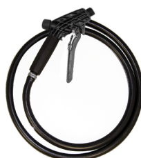
hochwertiger Schlauch, ölbeständig und kälteflexibel mit Sicherheitsverriegelung, 120 cm D10