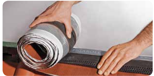
a.) Figaroll Plus exakt an First oder Grat anlegen und ausrollen.