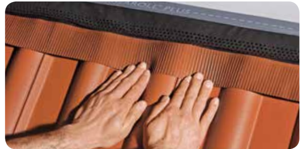
c.) Dank der hohen Dehnbarkeit erleichtert Figaroll Plus ein exaktes und leichtes Anformen, auch bei stark profilierten Dachpfannen.