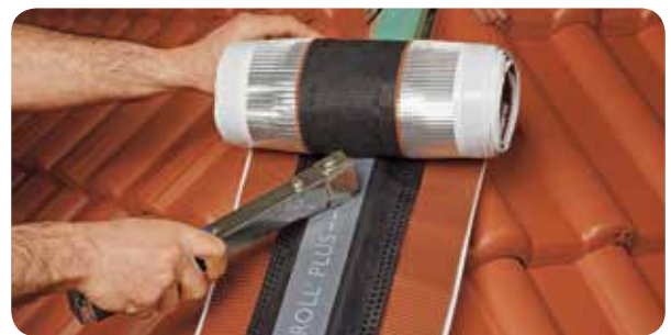
b.) Figaroll Plus durch den Nagelstreifen auf der First- oder Gratlatte befestigen.