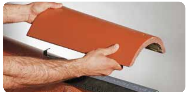
d.) Firststein oder -ziegel mit Firstklammer auf der Firstlatte befestigen.