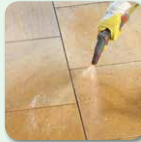
Fläche satt vornässen