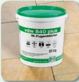
Fläche rückstandsfrei reinigen