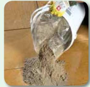
Mörtel portionsweise aufbringen