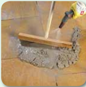
Mörtel mit Hartgummischieber und Wassersprühstrahl einarbeiten