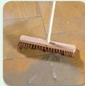
letzte Mörtelreste ggf. mit Kokosbesen entfernen